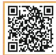
解密百業實境體驗網站